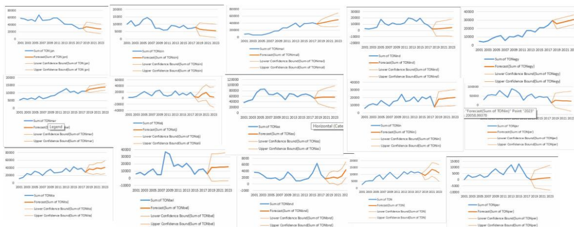
GAMBAR 2. GRAFIK RAMALAN JUMLAH PENGIRIMAN KOPI KE NEGARA EKSPOR

Kemudian, dalam meramalkan jumlah pengiriman ekspor, perhitungan dilakukan pada setiap negara tujuan secara terpisah, yang nantinya akan dijumlahkan per tahun setelah diperoleh ramalan jumlah ekspor pada masing-masing negara tujuan yang grafiknya disajikan pada Gambar 2 sebagai berikut.